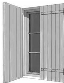
Volets à lames verticales ép 30 mm assemblage à clé (Barres en fourniture)