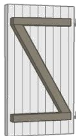
Volet a lames verticales ép 24 mm assemblage par barres et écharpe